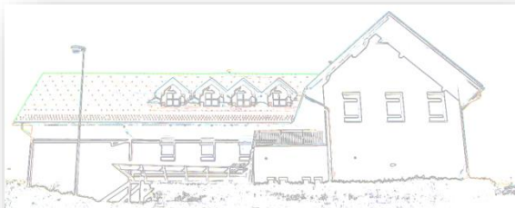
PODRUŽNIČNA ŠOLA DOLIČ