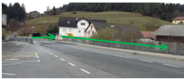
Slika 16; Križišče v Srednjem Doliču

Učenci morajo biti posebej previdni, ko prečkajo regionalno cesto (Slovenj Gradec-Vitanje) na prehodu za pešce, da se prepričajo, ali je varno prečkati cesto. Pot učenci nadaljujejo po pločniku in sicer po levem delu pločnika tako, da so kar najbolj odmaknjeni od cestišča.