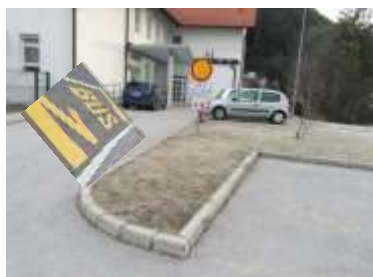
Slika 18; Predlog talne označbe pred šolo