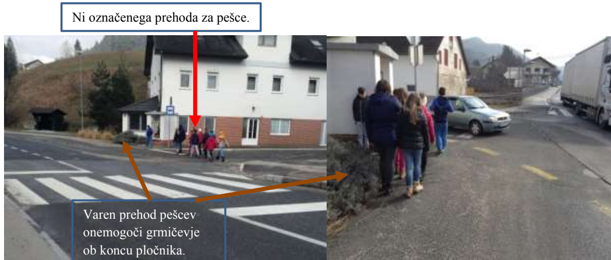
Slika 22,23; Prečkanje stranske ceste iz Tolstega Vrha