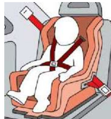
Slika 3; Uporaba ustreznih avtomobilskih sedežev

Starši morajo poskrbeti za kar največjo možno varnost otrok v vozilih. Upoštevati je treba, da otroci sedijo pripeti z varnostnim pasom na zadnjih sedežih, ko dosežejo višino 150 cm oziroma dopolnijo 12 let lahko sedijo na sopotnikovem sedežu.(ZPCP88/14). Za manjše otroke pa je potrebno uporabljati avtomobilske otroške sedeže, kateri morajo imeti ustrezno homologacijo. Predvsem je