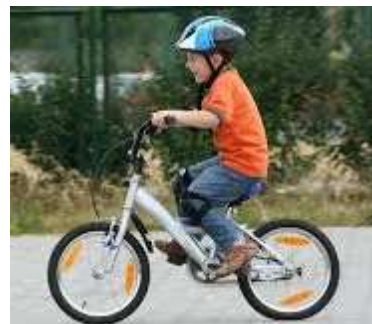
Slika 7; Obvezna oprema kolesa in kolesarja