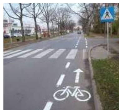
Slika 13; Varna rešitev za kolesarje

Na tem delu, kjer mora kolesar levo prečkati cesto, predlagamo talne označbe na cesti, s tem želimo opozoriti voznike na prisotnost kolesarjev.