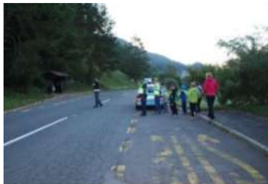
Slika 196; Prvošolčki s policistom