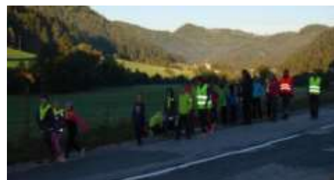
Slika 207; Pešci z odsevnimi telesi