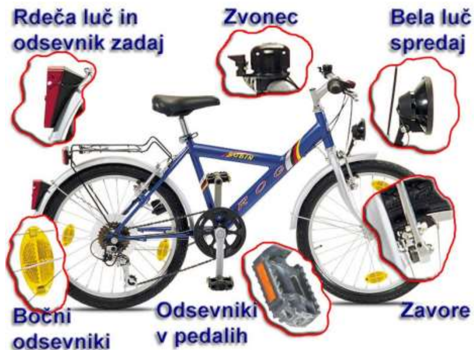
Slika 8; Obvezna oprema kolesa