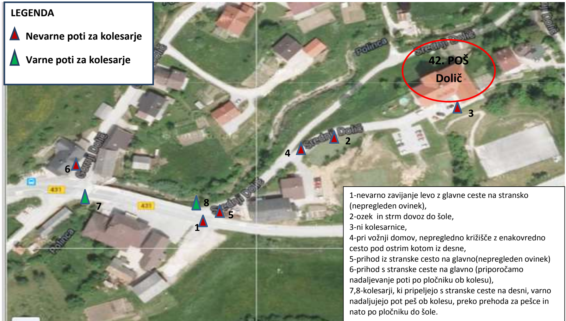
Slika 9; Varne in nevarne poti za kolesarje v okolici šole