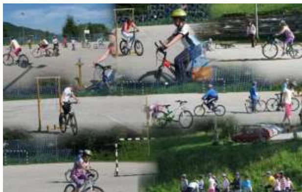
Slika 6; Praktični del kolesarskega izpita

Učenci, ki v šolo prihajajo s kolesi, morajo biti za to primerno opremljeni, vozijo lahko le varno opremljeno kolo, do 14. leta pa je obvezna uporaba kolesarske čelade. Učenci, ki še niso opravili kolesarskega izpita, se lahko po vozišču vozijo samo v spremstvu staršev. Vožnja s kolesom po pločniku je prepovedana. Učenci se za varno udeležbo v prometu s kolesom usposabljujejo v 5. razredu, ko opravijo tudi kolesarski izpit. Priprava na izpit poteka od oktobra do junija. Najprej učenci opravijo teoretični del izpita preko računalniškega programa. Sledi spretnostna vožnja in obvladovanje kolesa na spretnostnem poligonu (na igrišču OŠ Mislinja). Nato sledi usposabljanje kolesarjev za vožnjo na javnih površinah.