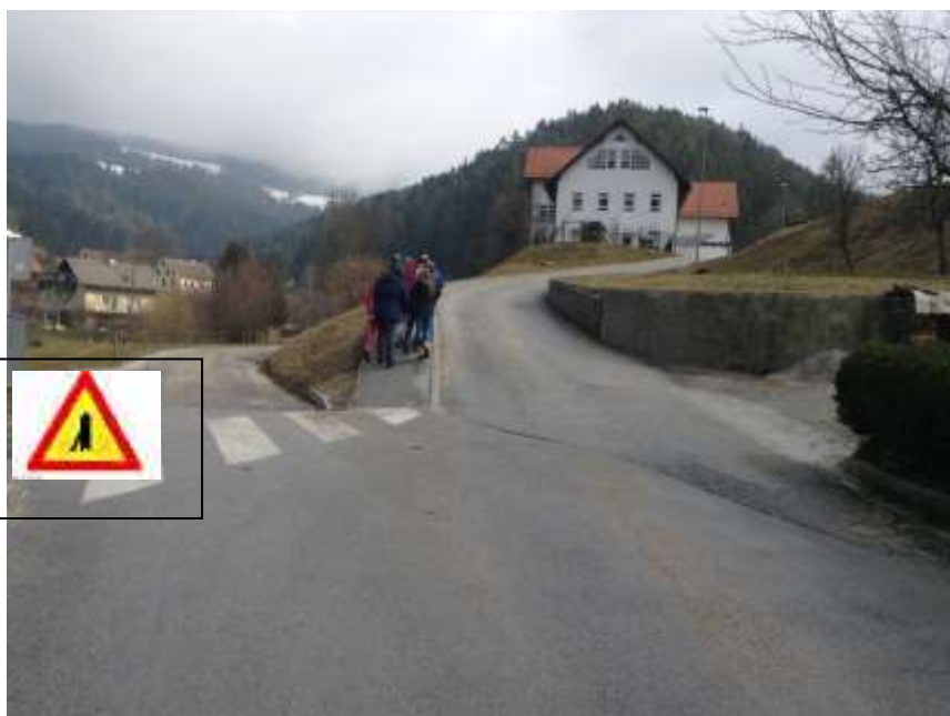
Slika 10; Učenci prepoznavajo varne in nevarne poti

Na nevarnost, na tem enakovrednem križišču, smo s petošolci opozorili lokalne ustanove. Ob ogledu so se strinjali z našo pobudo in obljubili, da bodo spremenili dovoz do šole, kot prednostno cesto.