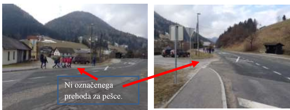
Slika 20,21; Prečkanje stranske ceste iz Kozjaka v Srednjem Doliču