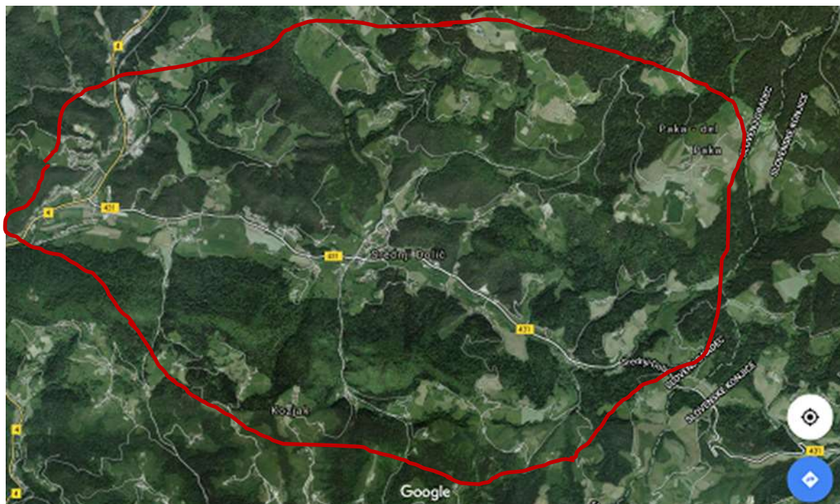
Slika 1;Šolski okoliš POŠ Dolič

Šolski okoliš POŠ Dolič zajema naselje Srednji Dolič ter del naselij Gornji Dolič, Spodnji Dolič (občina Vitanje), Kozjak, Tolsti Vrh in Paka.