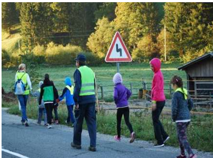
Slika 15; Hoja po prometno obremenjeni in poškodovani regionalni cesti Slovenj Gradec-Vitanje

Učenci na poti od doma do avtobusnega postajališča večino časa hodijo po lokalni in regionalni cesti in sicer ob levem ali desnem robu cestišča, odvisno od varnosti- to pa presodijo starši. Previdni morajo biti na promet, ki jih obkroža.