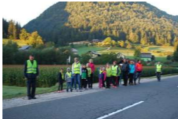
Slika 17; Učenci v spremstvu staršev spoznavajo nevarnosti v prometu

Na poteh, ki vodijo v šolo, učenci naletijo na marsikatero nevarnost v prometu. Na cestah, predvsem na regionalni, je pomanjkanje prehodov za pešce, tako da morajo biti učenci pri prehajanju iz ene strani ceste na drugo zelo previdni (večkratno preverjanje ali je cesta prosta za prehod).