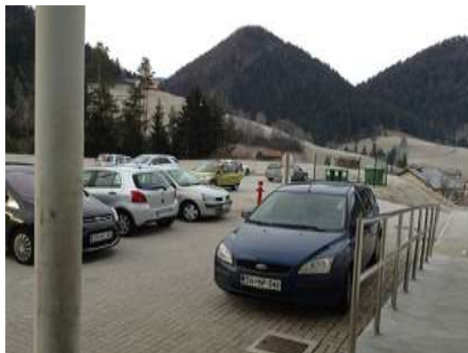
Slika 4; Parkirišče pred šolo

zasedemo z avtomobilom več parkirnih mest oz. da ne puščajo avtomobilov sredi dovoza. Posebej pozorni pa morajo biti, ko z otrokom zapuščajo avtomobil in nato prečkajo cesto ali dovoz.