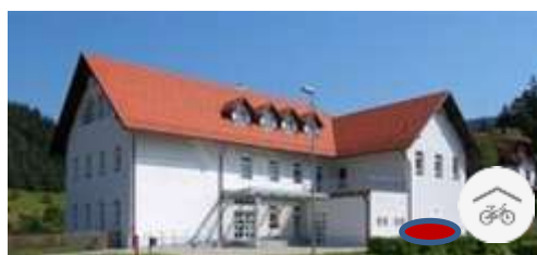
Slika 1918; Objubljena vzpostavitev parkirišča za kolesa