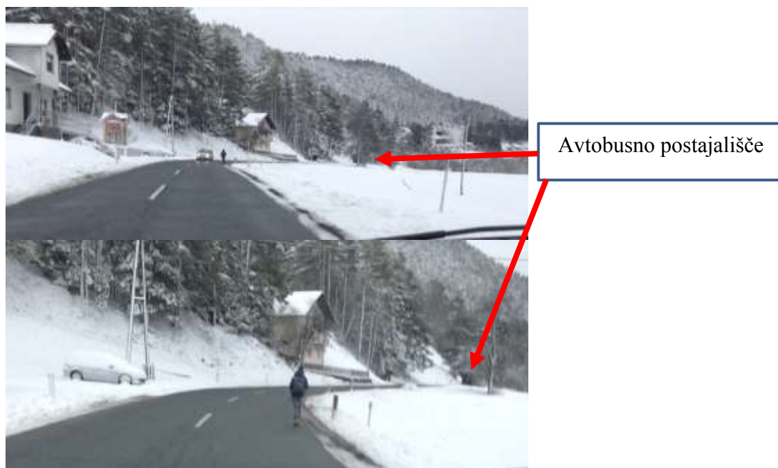
Slika 24, 25; Nevarna hoja pešca po cestišču regionalne ceste Slovenj Gradec- Vitanje